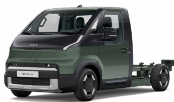
Cityscape Grün Metallic (CGE)