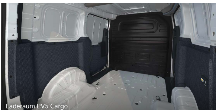
Laderaum PV5 Cargo