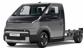
Stahlgrau Metallic (KLG)