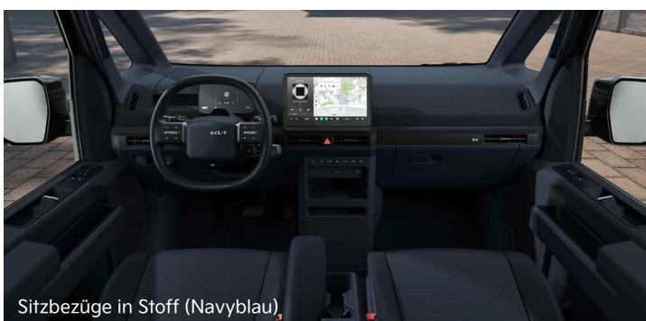
Sitzbezüge in Stoff (Navyblau)