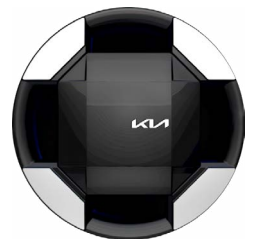
16-Zoll-Leichtmetallfelgen (Cargo: optional für Elite; Chassis Cab: optional für Plus)