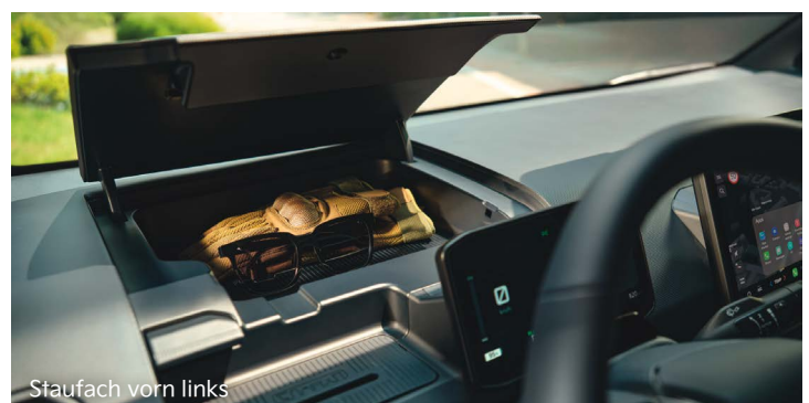
Staufach vorn links