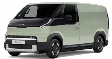
Soft Mint Metallic (SML)