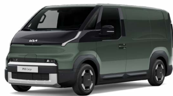
Cityscape Grün Metallic (CGE)