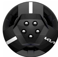
16-Zoll-Stahlfelgen mit Radabdeckung