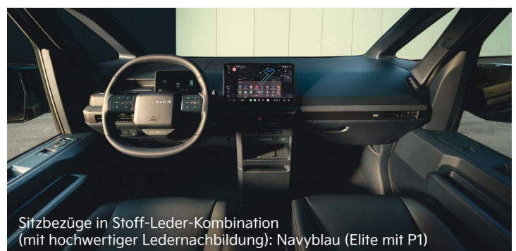
Sitzbezüge in Stoff-Leder-Kombination (mit hochwertiger Ledernachbildung): Navyblau (Elite mit P1)