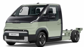
Soft Mint Metallic (SML)