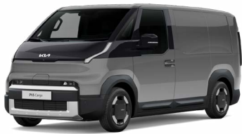
Stahlgrau Metallic (KLG)